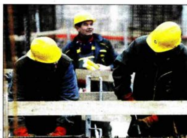
Bitka sa željezom i betonom za radnike ne predstavlja problem