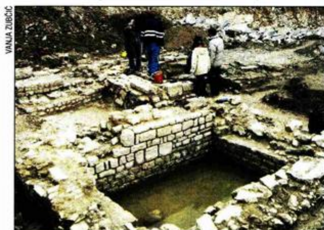
Arheolozi su na gradilištu pronašli ostatke rimske vile