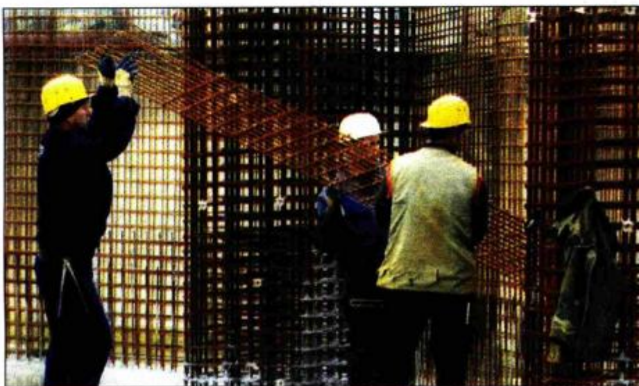
Postavlja se armatura za gradnju zida druge etaže

Radnici postavljaju armaturu za drugu etažu, iznad koje će se graditi tribine