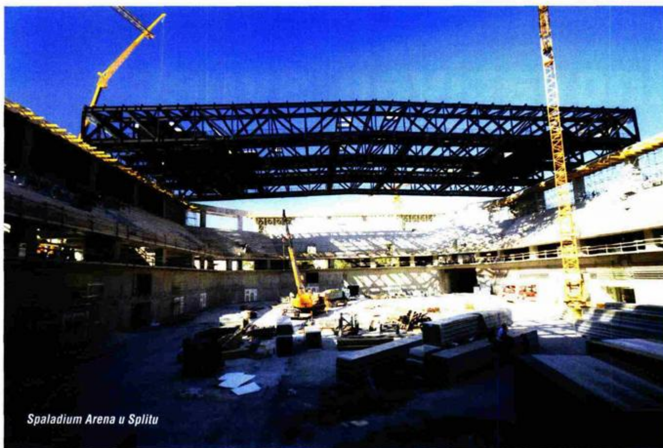
Spaladium Arena u Splitu