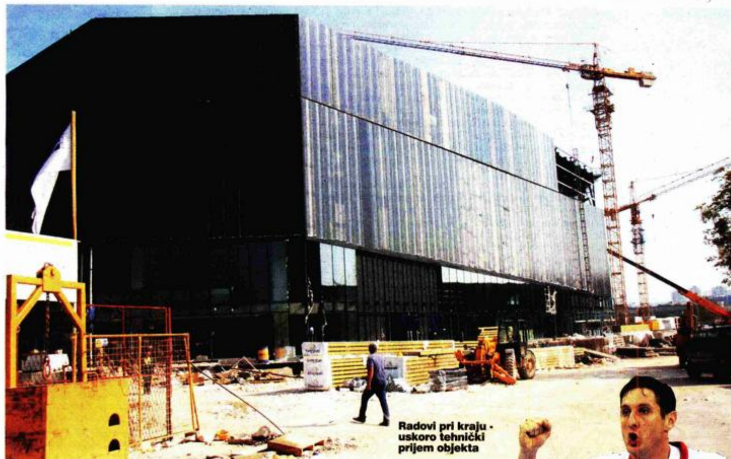
Radovi pri kraju - uskoro tehnički prijem objekta