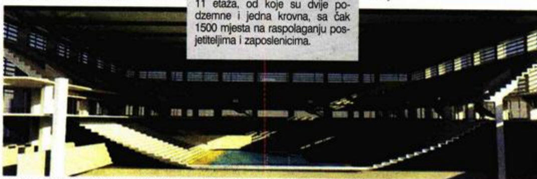
Bruto površina dvorane je 4.100 kvadrata i imat će 12.000 sjedećih mjesta

No, kada je trebalo i formalno donijeti odluku o gradnji dvorane, a samo tri mjeseca uoči parlamentarnih izbora prošle godine, svi su redom podignuli ruke. Gradsko vijeće tada je, kao rijetko kad, bilo jednoglasno.