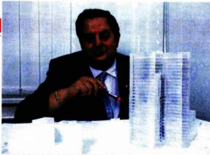
ISPRED makete nebodera Sky Office koji se grade u kvartu Rudeš u Zagrebu

- U svojoj poslovnoj karijeri polako sam se penjao u Dalekovodu. Dovoljno dugo da na vrijeme shvatim da bez izvoza i osvajanja inozemnih tržišta Dalekovod neće moći opstati. Kako bismo snažno iskoračkuli na strana tržišta, i sam Dalekovod je trebalo privatizirati. Odlučio sam okupiti ljude i učiniti sve da se ta privatizacija ne dogodi po modelu tada popularne tajkunizacije. Želio sam privatizaciju bez ijedne mrlje. Godine 1992. dionice Dalekovoda pojavile su se u Fondu za obnovu. Organizirao sam u početku 160 ljudi, od inženjera, rukovoditelja, poslovođa do radnika, podigli smo kredite, provedli dva programa ESOP, zaposleničkog stjecanja vlasništva nad trezorskim dionicama, i privatizirali tvrt-