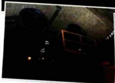
TUNELI na autocesti Zagreb - Split opremljeni su rasvjetom i opremom za sigurnost

Pod Miličićevim vodstvom Dalekovod je osvojio skandinavsko tržište. Nakon izgradnje dalekovoda na Islandu, zagrebačka Dalekovod Grupa 1997. dobila je prvi od dvaju velikih poslova u Norveškoj, a uskoro će raditi u Švedskoj i Finskoj. Dalekovod gradi dalekovodne mreže u Albaniji i Kazahstanu, za godinu i pol će u Južnoafričku Republiku. Prisutan je i na tržištu Poljske, Njemačke, Ukrajine, Kosova, Slovenije, Namibije te Bosne i Hercegovine.