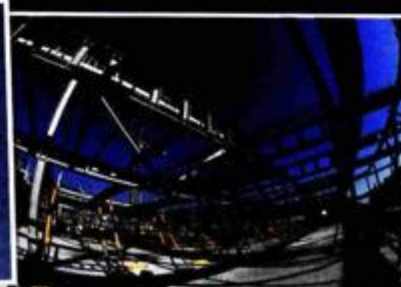
NOVU ZGRADU Hitne pomoći u Zagrebu Dalekovod radi sa željeznim konstrukcijama