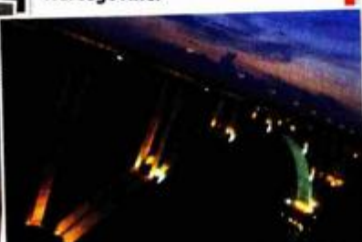
MOST KRKA dužine 391 metar pokraj Skradina Dalekovod je osvijetlio