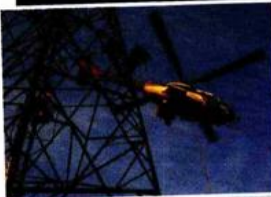
HELIKOPTERI pomažu pri montaži električnih dalekovoda

Miličić s menadžerima u Dalekovodu koji ima 6000 dioničara