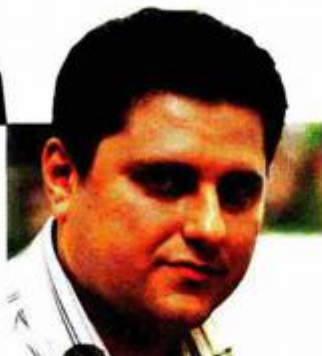
Piše: Krešimir Kopešjak

Zagrebački je Franck prvo polugodište završio s 22,8 milijuna kuna neto dobiti što je bilo za 29,4% više od dobiti ostvarene u istom prošlogodišnjem razdoblju. Pritom su ukupni polugodišnji prihodi Francka porasli 15 posto na iznos od 284,2 milijuna kuna, dok su ukupni rashodi rasli jednakim intenzitetom, a iznosili su 253,4 milijuna kuna. Najveći dio prihoda (234,9 milijuna kuna), ostvaren je na domaćem tržištu, dok se 32,1 milijuna kuna