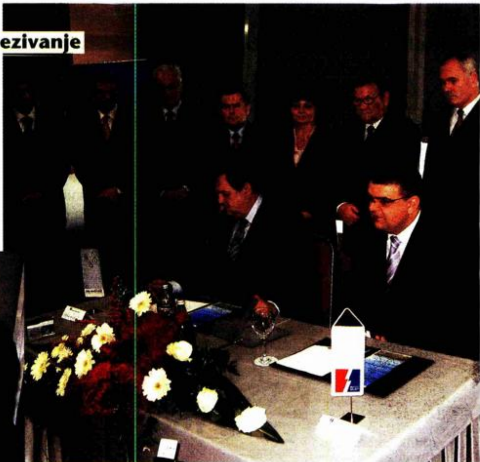
Potpisan ugovor za izgradnju DV 2x400 kV Ernestinovo - Pečuh, dionica Ernestinovo - državna granica